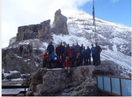
Dom Camillo Giussani 2600 m

26. jul 2011, utorak – Za današnji dan predviđen je povratak u Srbiju. Oko 08.30 polazimo iz doma, još jednom se slikamo i polako krećemo do podnožja, gde nas čeka autobus. U povratku, nakon prepakivanja i presvlačenja na velikom parkingu, koristimo par sati da obiđemo i gradić Cortina d'Ampezzo. Divan italijanski gradić u samom podnožju predivnih masiva.