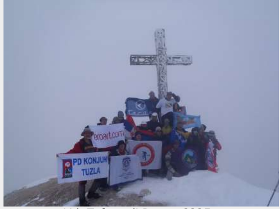
Vrh Tofana di Rozes, 3225m

U domu se okupljamo oko velikog stola, skoro cela naša grupa, pijemo pивce i prepričavamo prethodne događaje. Malo kasnije pratimo i lep običaj da se svim društvima učesnicima pošalju razglednice mesta i planine na kojoj smo.