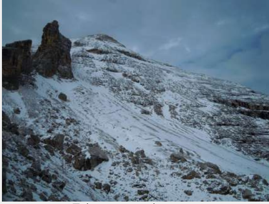
Tek smo na pola puta...