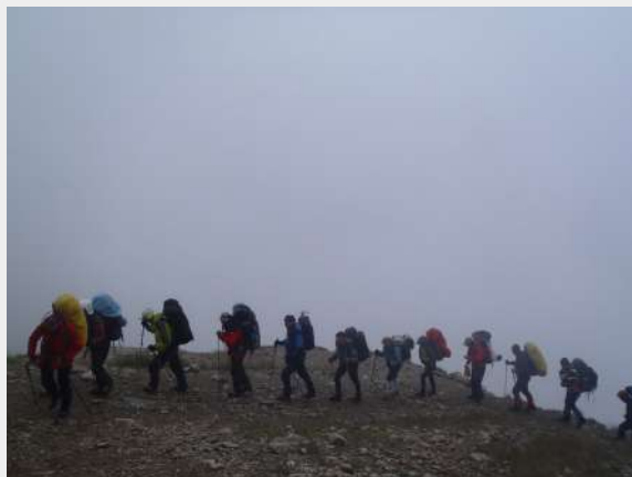
Na putu do doma Tete Rouse

Prizor prelep. Sneg svud okolo, prava planinarska atmosfera, a vrhovi koji nas očekuju su tu, sasvim blizu. Uskoro ćemo im se približiti još