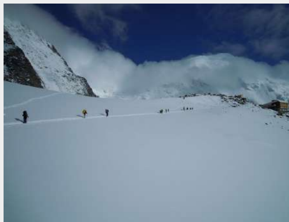
Plato ispred doma doma Tete Rousse 3167 m