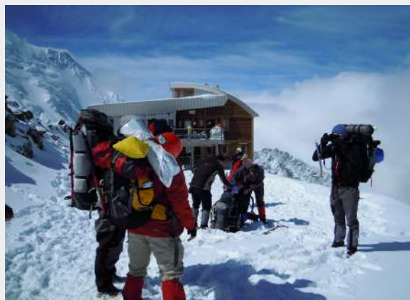
Slikanje ispred doma pred povratak

24. jul 2011, nedelja – Prvo što smo uradili kada smo se ujutro probudili, bilo je da pogledamo kroz prozor i osmotrimo kakvo je vreme. Puno novog napadalog snega. U planu je bio izlazak do drugog doma na 3817 mnv, prolazak kroz kuloar i savladavanje stene od 600 m. Polako ustajemo i odlazimo do boravka. Treba nešto jesti. Polazak je bio predviđen za 06.00 ali je isti odmah bio odložen za kasnije, da vidimo šta će biti sa vremenom. Dok smo doručkovali, napolju je počelo da se razvedrava. Prognoza, kako čujemo, nije idealna, ali smo svi bili zatečeni odlukom vodiča da je „najbolje“ da se vratimo. Razlozi za ovu odluku su bili: loša prognoza za naredne dane, zaleđena stena i broj ljudi koji bi trebalo da je pređe, mada se od početka znalo koliko ljudi je krenulo, kakvog su iskustva i spremnosti. No nije nas začudila odluka o čuvanju bezbednosti grupe, već odluka da se ne iskoristi ni jedan, jedini rezervni dan, kao i odluka da se vratimo, a da nismo ni probali da izađemo do drugog doma. To nismo mogli ni naslutiti, ni očekivati.