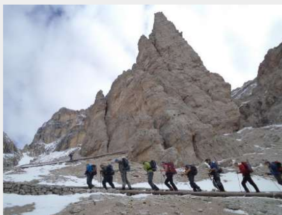
Napredovanje ka drugom domu

Nakon kratke pauze nastavljamo dalje. Do vrha još 650m visine. Pogled na okolne vrhove, kanjone, stene nas sve oduševljava. Povremeno se navlače oblaci koji nam zaklanjaju vidik i nagoveštavaju još jedan snežni dan. To nam, ipak, ne remeti uspon. Staza je na nekim mestima klizava i pod ledom. Pred sam vrh staza prelazi u sipar kojim se treba kretati posebno oprezno. Oko 15.00 izlazimo i na vrh Tofana di Rozes, 3225 mnv na kojem se nalazi veliki krst. Nažalost, pogled nam je uskraćen, jer je oko nas samo magla. Vetar počinje da duva i postaje hladno. Dočekujemo celu ekipu, slikamo se sa zastavama na vrhu i uskoro krećemo nazad. S obzirom da ćemo spavati u domu, imamo dovoljno vremena da se bez žurbe sigurno spustimo.