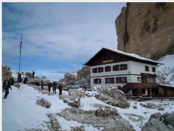
Tofana di Rozes

Polazna tačka nam je bila na 1700 mnv, a predviđeno je da za taj dan popnemo vrh Tofana di Rozes, 3225 mnv i uveče da se vratimo. Na uspon smo krenuli oko 07.30. Kao što rekoh, staze savršeno markirane, svaka ima svoj broj, putokazi vidljivi i nepogrešivi. Prvu pauzu pravimo kod doma Dibona 2083 mnv nakon što smo izašli iz prelepe četinarske šume. Tu nam se otvaraju i prvi pogledi na fantastične vrhove koji prstom mame svojom lepotom. Svakako da ne može biti adekvatna zamena za planirani Mon Blan, ali zaista najlepše što je moglo. Od tog doma pa naviše počinje da se javlja i sneg. Put širok i lagan za hod. Polako napredujemo i oko 11.00 stižemo i do drugog doma Camillo Giussani na 2600 mnv. Kad smo stigli do tog doma, vodiči su doneli odluku da tu i prespavamo, da ne bismo žurili sa vrha. Dom je zaista prelep, a osoblje su planinari i vrlo su ljubazni.