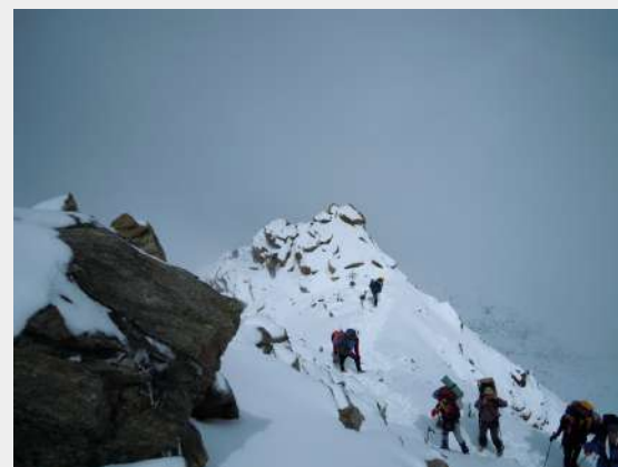
Neki dole - neki gore...