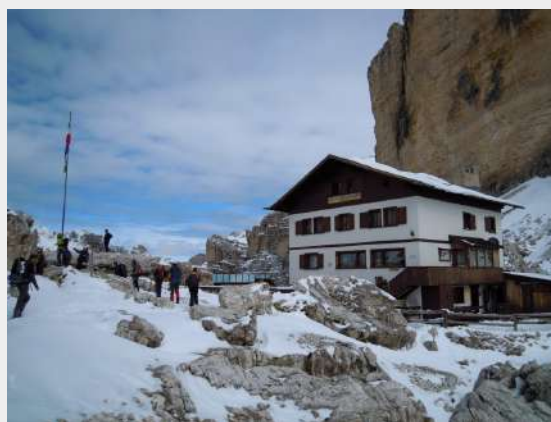
Ispred doma Camillo Giussani, 2600m