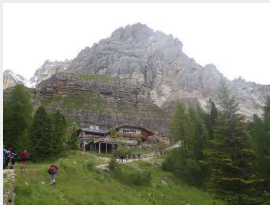
Prvi dom na 2.083 m - Dibona

Nakon kratke pauze nastavljamo dalje. Do vrha još 650m visine. Pogled na okolne vrhove, kanjone, stene nas sve oduševljava. Povremeno se navlače oblaci koji nam zaklanjaju vidik i nagoveštavaju još jedan snežni dan. To nam, ipak, ne remeti uspon. Staza je na nekim mestima klizava i pod ledom. Pred sam vrh staza prelazi u sipar kojim se treba kretati posebno oprezno. Oko 15.00 izlazimo i na vrh Tofana di Rozes, 3225 mnv na kojem se nalazi veliki krst. Nažalost, pogled nam je uskraćen, jer je oko nas samo magla. Vetar počinje da duva i postaje hladno. Dočekujemo celu ekipu, slikamo se sa zastavama na vrhu i uskoro krećemo nazad. S obzirom da ćemo spavati u domu, imamo dovoljno vremena da se bez žurbe sigurno spustimo.